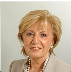
Adriana Poli Bortone